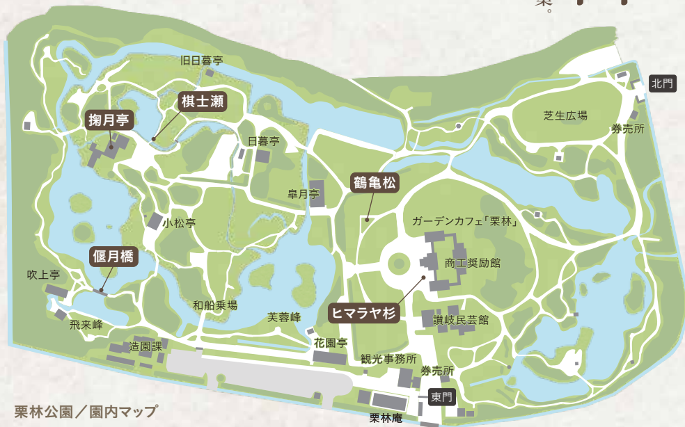
栗林公園 / 園内マップ