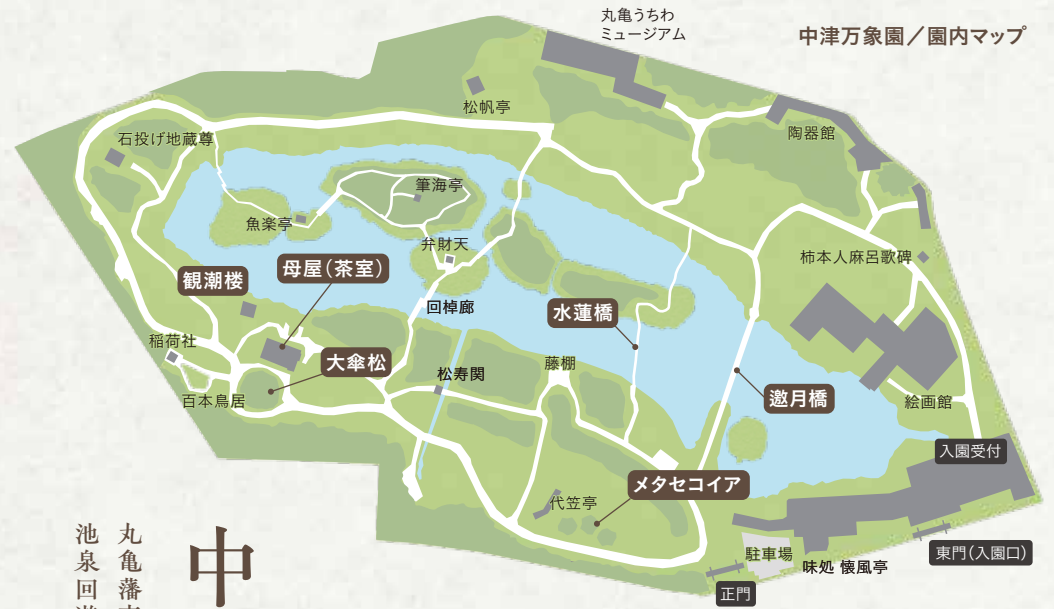
中津万象園 / 園内マップ